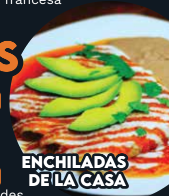
ENCHILADAS DE LA CASA

280g de pechuga de pollo empanizado en opción búfalo, BBQ o mango habanero acompañados de vegetales (apio y zanahoria) en aderezo ranch con una pequeña porción de papas a la francesa