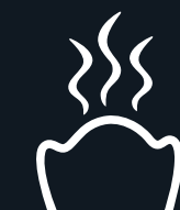
LA CASA DEL PANQUÉ

Una opción para los peques, pizza individual hecha de manera artesanal con nuestra salsa de tomate, queso gratinado y jamón. Si no eres tan peque, puedes elegir 2 ingredientes: tocino, morrón, jamón, chorizo, jalapeño o pepperoni