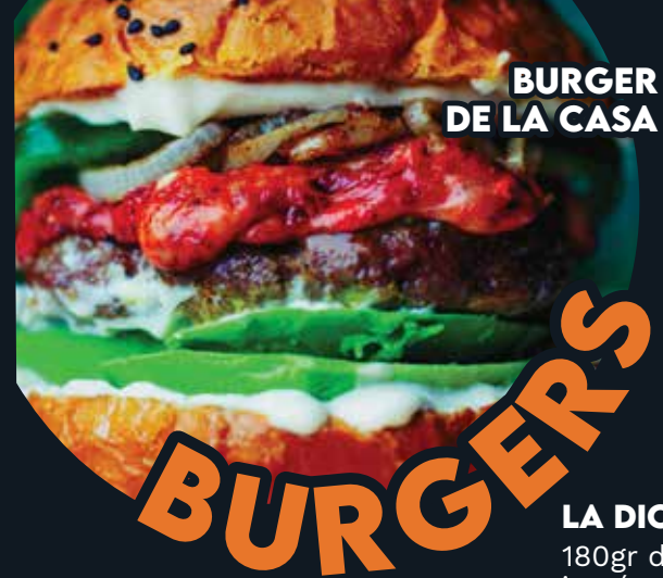
BURGER DE LA CASA

Delicioso pan de mantequilla con mayonesa, aguacate queso manchego y suizo con jamón de pavo. Acompañados de un mix de ensalada