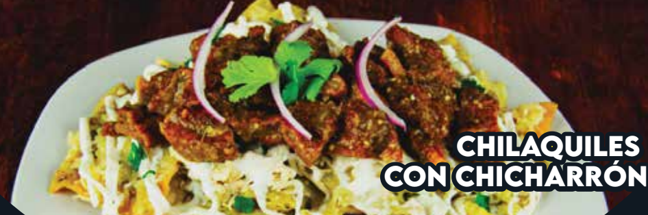
CHILAQUILES CON CHICHARRÓN